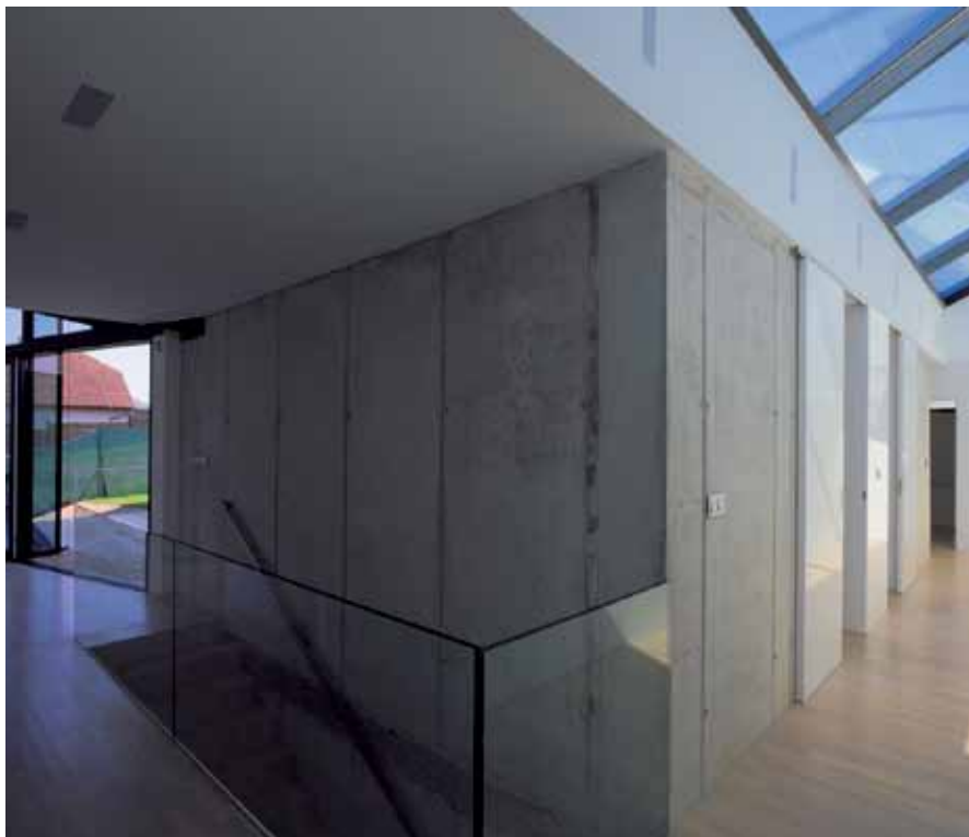
14 Z obývacej haly sa popri zasklenej fasáde otočenej k terase a do záhrady prechádza do nočnej časti domu so spálňou, hygienickým zázemím a šatníkom. Zasklená fasáda sa viaže ku všetkým obytným častiam domu a je dôležitým architektonickým prvkom jeho západnej strany. Nadrozmerné posuvné dvere zasklenej fasády sú umiestnené pod šikmým stropom, pričom konzola hornej vodiacej koľajnice je upevnená na špeciálne vyhotovenom oceľovom nosníku. Surový betón na vnútornej nosnej stene vytvára kontrast s dokonale hladkým povrchom bielej gletovanej omietky.