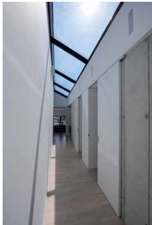
15 Strop v chodbe nočnej časti tvorí v celom rozsahu zasklený svetlák, slnečné lúče tu vytvárajú vždy inú atmosféru.

K2 je jednogeneračný rodinný dom navrhnutý v susedstve Domu zlomu. Svahovitý terén a požiadavky užívateľov priniesli ideu domu, ktorý „stúpa“ do svahu. Sledovanie svahovitého terénu sa z hľadiska prevádzkového konceptu domu viaže k dvom jednoramenným schodiskám, ktoré v interiéri prekonávajú výškový rozdiel terénu medzi vstupnou uličnou a záhradnou časťou pozemku, pričom vytvárajú tri samostatné, oddelené výškové úrovne. Schodiskové ramená sa prejavujú aj v tvarovaní domu a tvoria jeho základnú, veľmi originálnu formu v uličnom pohľade. Rozdelenie domu na tri samostatné úrovne umožnilo dôsledne naplniť dôležitú požiadavku užívateľov – čo najlepšie prevádzkovo aj zvukovo oddeliť pracovňu od hlavnej obytnej časti domu. Zaujímavá je najmä strecha stavby. Z úrovne záhradnej terasy za domom špirálovito stúpa systémom naklonených rovín ponad vnútorné schodiskové ramená pri uličnej fasáde až do najvyššej strešnej úrovne. Väčšia časť strechy bude zatrávnená a pochádzna. Domy K2 a vedľajší Dom zlomu patria k sebe a budú využívané jednou širšou rodinou. Zámerom pri navrhovaní domu K2 však nebolo vytvoriť kompozičný doplnok pre vedľajší objekt, ale ďalší plnohodnotný dom s vlastnou originálnou koncepciou.